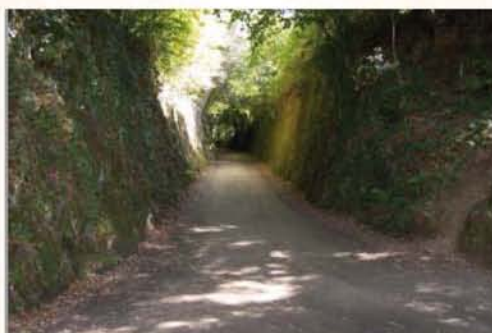
Cet impressionnant chemin creux a été réalisé lors de la construction de la grande digue.