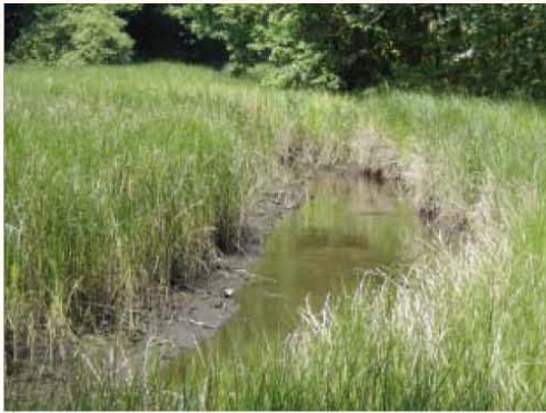
Bras de mer et scirpes maritimes.

Les petits bateaux de pêche remontaient au fond de l'anse, comme le montre cette carte postale ancienne.