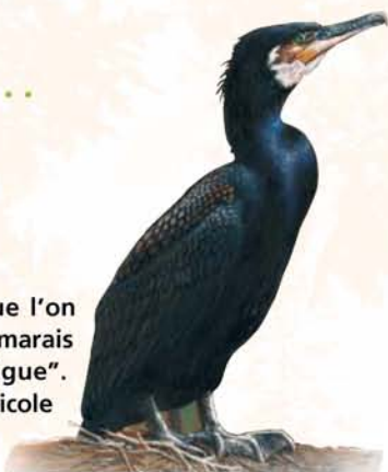
Le grand cormoran est un "pêcheur" habitué des lieux.

Louis Sancéau est né dans ce que l'on appelle maintenant la Maison des marais et que l'on nommait alors "La Digue". Il se souvient fort bien de l'activité piscicole de Penfoulic dans les années quarante.